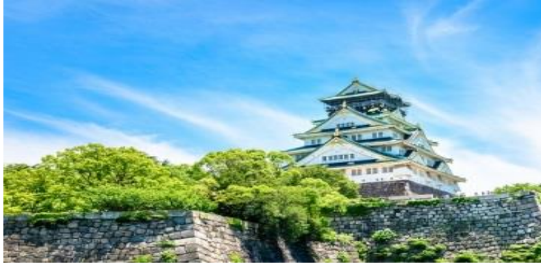
ปราสาทโอซาก้า (Osaka Castle)

โอซาก้าเป็นเมืองที่ใหญ่ที่สุดเป็นอันดับสองของญี่ปุ่น ตั้งอยู่ในภูมิภาคคันไซ บนเกาะฮนชู โอซาก้าเป็นเมืองที่มีประวัติศาสตร์และวัฒนธรรมที่ยาวนาน เป็นที่รู้จักจากอาหารอร่อย ผู้คนที่เปี่ยมมิตร และสถานที่ท่องเที่ยวมากมาย