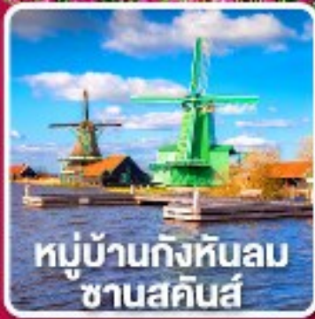
หมู่บ้านกังหันลม ซานสคินส์

เข้าชมเทศกาล สอนดอกไม้เคอเคนฮอฟ 1 ปีมีครั้งเดียว