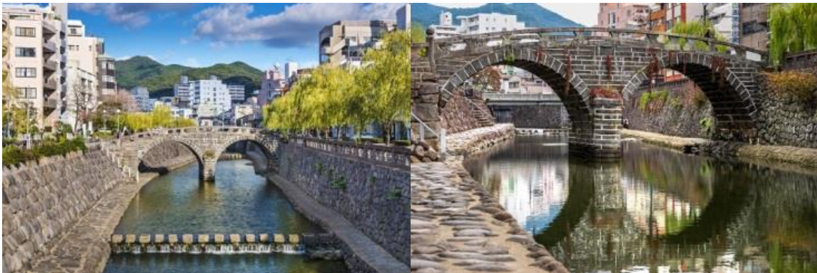
สะพานเมกานะบาชิ (Meganebashi Bridge)

นากาซากิ (Nagasaki) เป็นเมืองที่ตั้งอยู่ทางตะวันตกของเกาะคิวชู ประเทศญี่ปุ่น เมืองนี้เป็นที่รู้จัก จากประวัติศาสตร์อันยาวนานและวัฒนธรรมที่หลากหลาย เมืองนี้เป็นที่รู้จักจากชายหาดที่สวยงาม อาหารทะเลสด และสถานที่ท่องเที่ยวทางประวัติศาสตร์และวัฒนธรรมมากมาย