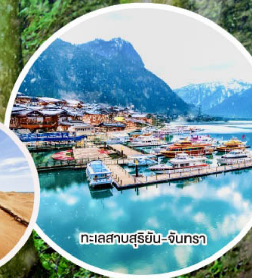
ทะเลสาบสุริยัน-จันทรา