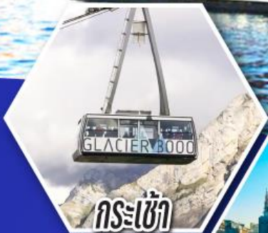
กระเช้า กลาเซียร์ 3000