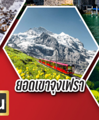
ยอดเขาจุงเฟรา