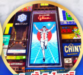
ช้อปปิ้งชินโซบาชิ

เดินทาง 14-19, 21-26 ม.ค. 68 06-11, 13-18 ก.พ. 68 13-18 มี.ค. 68