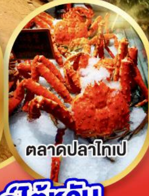
ตลาดปลาไทเป