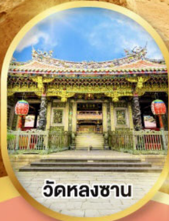
วัดหลงซาน