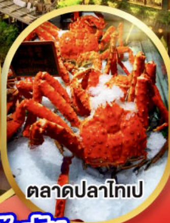
ตลาดปลาไทเป