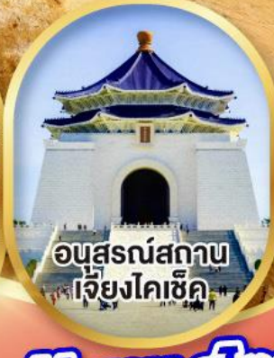
อนุสรณ์สถาน เจียงไคเช็ค