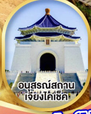
อนุสรณ์สถาน เจียงไคเช็ค