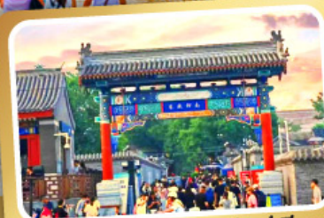
ถนนโบราณหนานหลิวกุ่เซียง