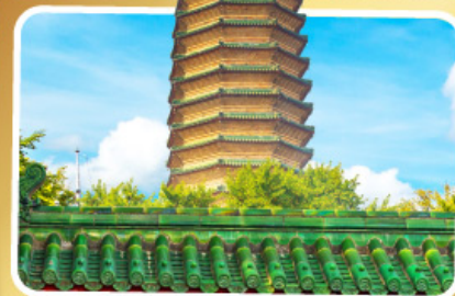
วัดพระเจี๊ยะเก้ว