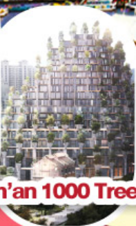
Tian'an 1000 Trees