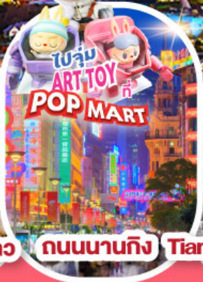
ถนนนานกิง