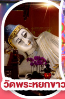
วัดพระหยกขาว