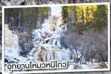
อุทยานโหมวหนี่โกว