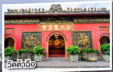
วัดต้าถื่อ