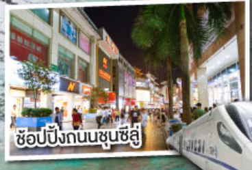
ช้อปปิ้งถนนชุนซีลู่