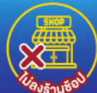
ไม่จ่าร้านซื้อ