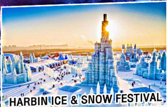
HARBIN ICE & SNOW FESTIVAL