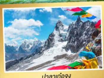
ปาลาก่อง