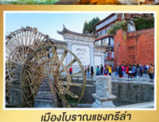
เมืองโบราณเซงกรีล่า