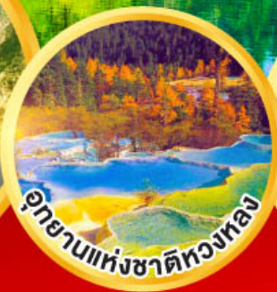
อุทยานแห่งชาติหลงหลง