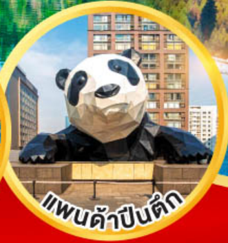
แพนด้าป็นดัก