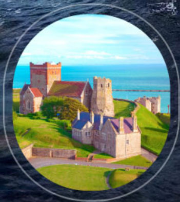
United Kingdom Dover