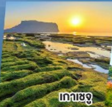
เกาะเชจู