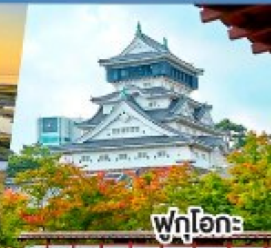
ฟูกูโอกะ