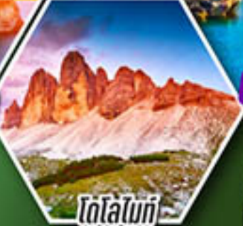
โดโลไมท์

โปรแกรมเดียว เก็บครบจบ อิตาลี ตั้งแต่เหนือถึงใต้