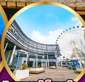
มิตซูเอากะที่เล็ดพาร์ค เซนได