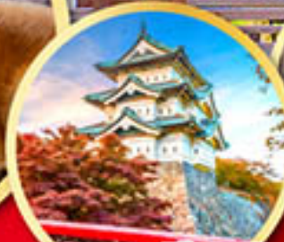
ปราสาทอิโรฮาเกะ