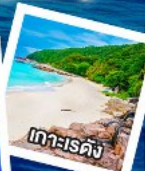
เกาะเรดัง