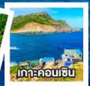
เกาะคอนเซิน