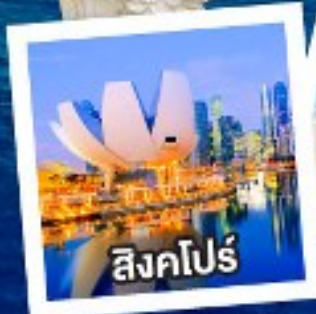
สิงคโปร์