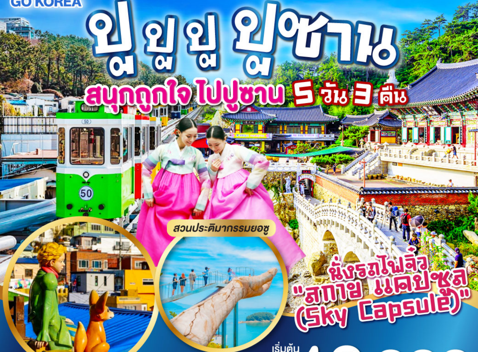
สวนประติมากรรมยอซู