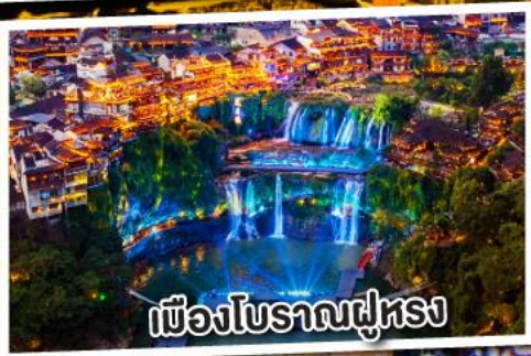
เมืองโบราณฝูหลง