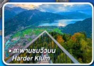
• สะพานชมวิวน Harder Klum