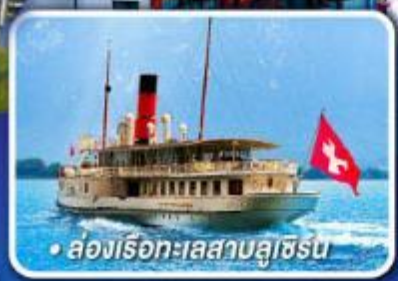
• ล่องเรือทะเลสาบลูซิเิร์น