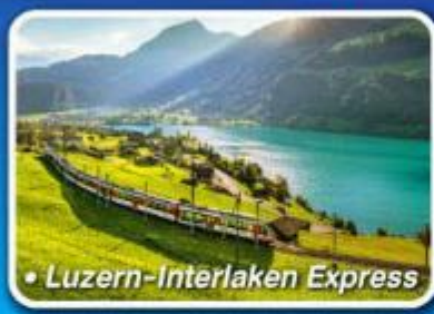
• Luzern-Interlaken Express