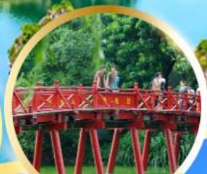
สะพานแสงอาทิตย์