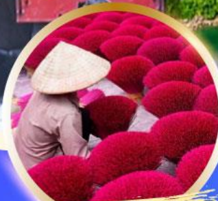
หมู่บ้านรูป Phu Cau