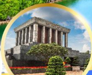
สุสานลุงโฮ