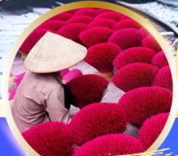
หมู่บ้านรูป Phu Cau