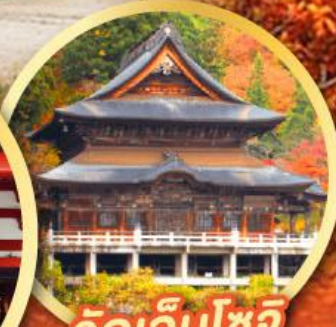
วัดเอ็นโซจิ

กิจกรรมเก็บผลไม้ พักออนเซ็น 2 คืน พักโรงแรมในโตเกียว 2 คืน