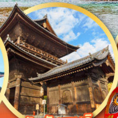
วัดนันเซนจิ