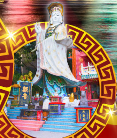
เจ้าแม่กวนอิม ทาดริพัลล์เบย์