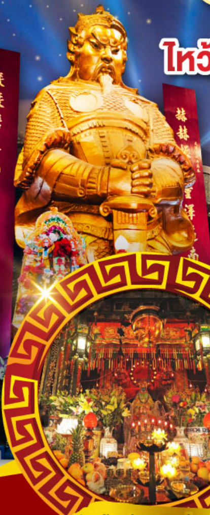
วัดเจ้าแม่กวนอิมซ้องฮำ