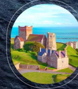
United Kingdom Dover

ราคารวม : อาหารทุกมื้อบนเรือสำราญ, ทิปพนักงานบนเรือ, ภาษีท่าเรือ | ราคาไม่รวม : ตัวเครื่องบิน, ค่าทำวีซ่า, ที่วีซ่าเสริมบนฝั่ง