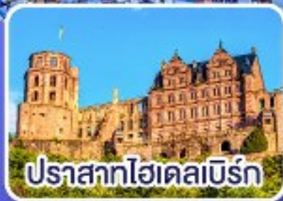
ปราสาทไฮเดลเบิร์ก