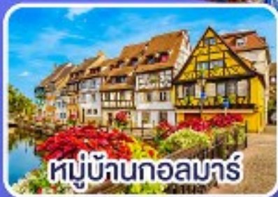
หมู่บ้านกอลมาร์