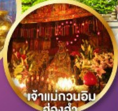
เจ้าแม่กวนอิม ฮ่องกง