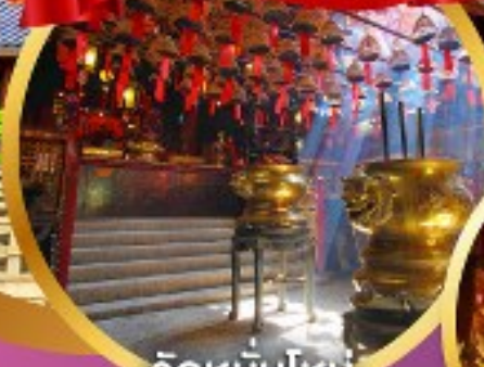
วัดหมื่นโหม่