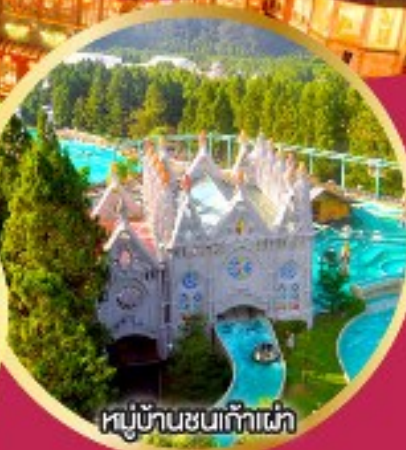
หมู่บ้านชนเก้าเผ่า