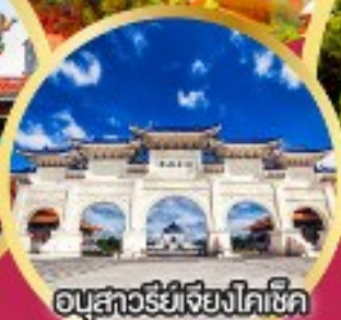
อนุสาวรีย์เจียงไคเช็ค