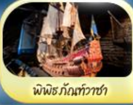
พิพิธภัณฑ์ทิวาชา