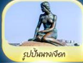
รูปปั้นนางเงือก