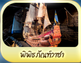
พิพิธภัณฑ์ทิวาซ่า