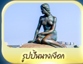
รูปปั้นนางเงือก