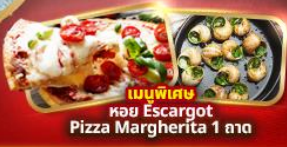
เมนูพิเศษ หอย Escargot Pizza Margherita 1 ถาด

แถมฟรี! น้ำดื่ม 1 ขวดทุกวัน, ปลั๊กไฟยูนิเวอร์แซล