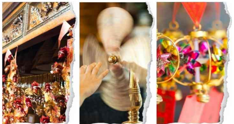
วัดแซกงหมิว

นำท่านขอพรเพื่อเป็นสิริมงคล วัดแห่งนี้เป็นวัดที่คนฮ่องกงให้การเคารพนับถือเป็นอย่างมาก เป็นวัดเก่าแก่ และมีชื่อเสียงที่สุดวัดหนึ่งของฮ่องกง เป็น 1 ในวัดของฮ่องกงที่ทุกท่านห้ามพลาดเลยทีเดียวนะ