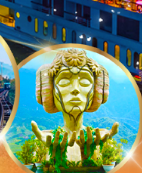
โมนาน่า คาเฟ่