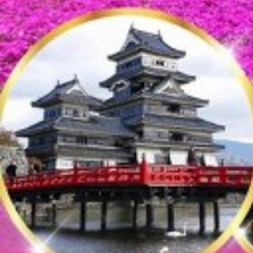
ปราสาทมัตสึโมโตะ