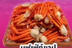
บุฟเฟ่ต์ซาปู