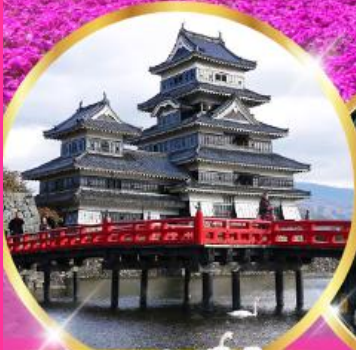
ปราสาทมัตสึโมโตะ