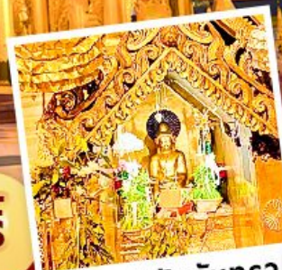
พระสุริยอินจันตรา