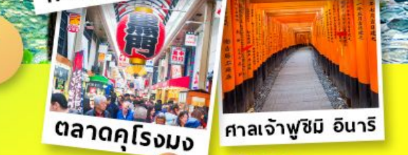
ตลาดคูโรมง ศาลเจ้าฟูชิมิ อินาริ