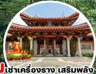
บูเช่าเครื่องราง เสริมพลัง Lian Shan Shuang Lin Temple