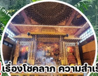
บูเรื่องโชคลาภ ความสำเร็จ Loyang Tua Pek Kong Temple