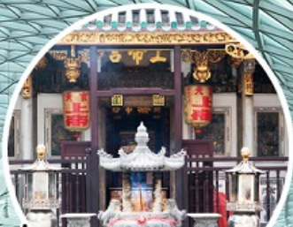
บูเรื่องรัก ขอบครอบครัว ขอลูก Yueh Hai Ching Temple

ทัวร์สิงคโปร์ 3วัน 2 คืน โดยสายการบิน Thai Lion Air (SL)