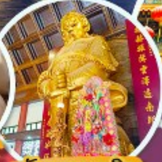
วัดเขากงเมี้ยว