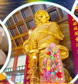
วัดแซกงเมียว