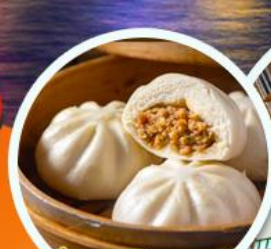
ตีมซาฮ่องกง