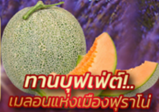
🍈 ทานบุฟเฟ่ต์! เมลอนแห่งเมืองฟุราโน่