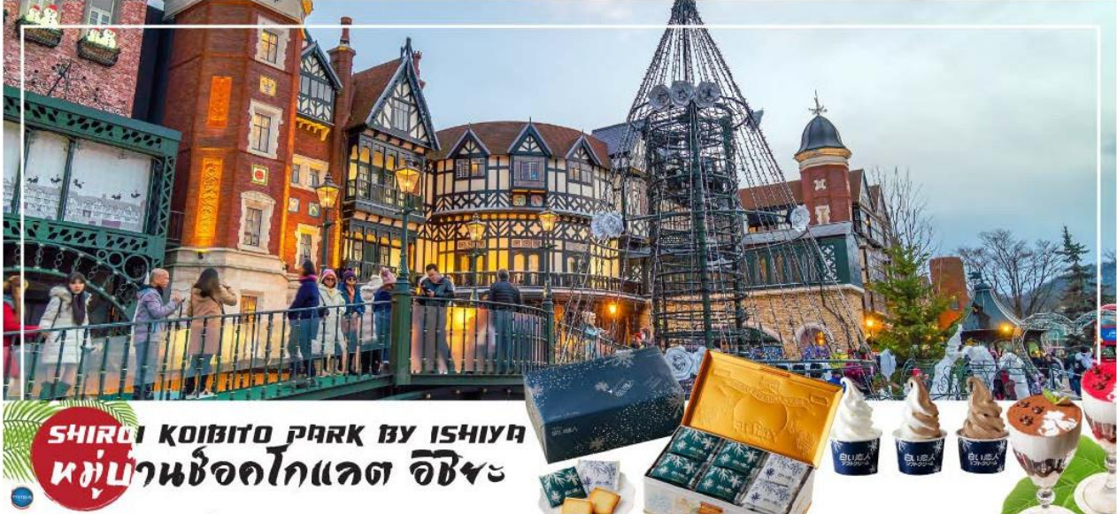
SHIROI KOIBITO PARK BY ISHIYAKI หมู่บ้านช็อคโกแลต อิชียะ

โกแลตที่ขึ้นชื่อที่สุดของที่นี่คือ Shiroi Koibito ซึ่งมีความหมายว่าช็อคโกแลตขาวแต่คนรัก ท่านสามารถเลือกช็อคกลับไปให้คนที่ท่านรักทานหรือว่าซื้อเป็นของฝากติดไม้ติดมือกลับบ้านก็ได้ นอกจากนี้ท่านจะได้เลือกซื้อช็อคโกแลตที่หาซื้อที่ไหนไม่ได้ และ ท่านก็ยังจะได้ชมประวัติความเป็นมาของโรงงาน และการผลิตช็อคโกแลตอีกด้วย