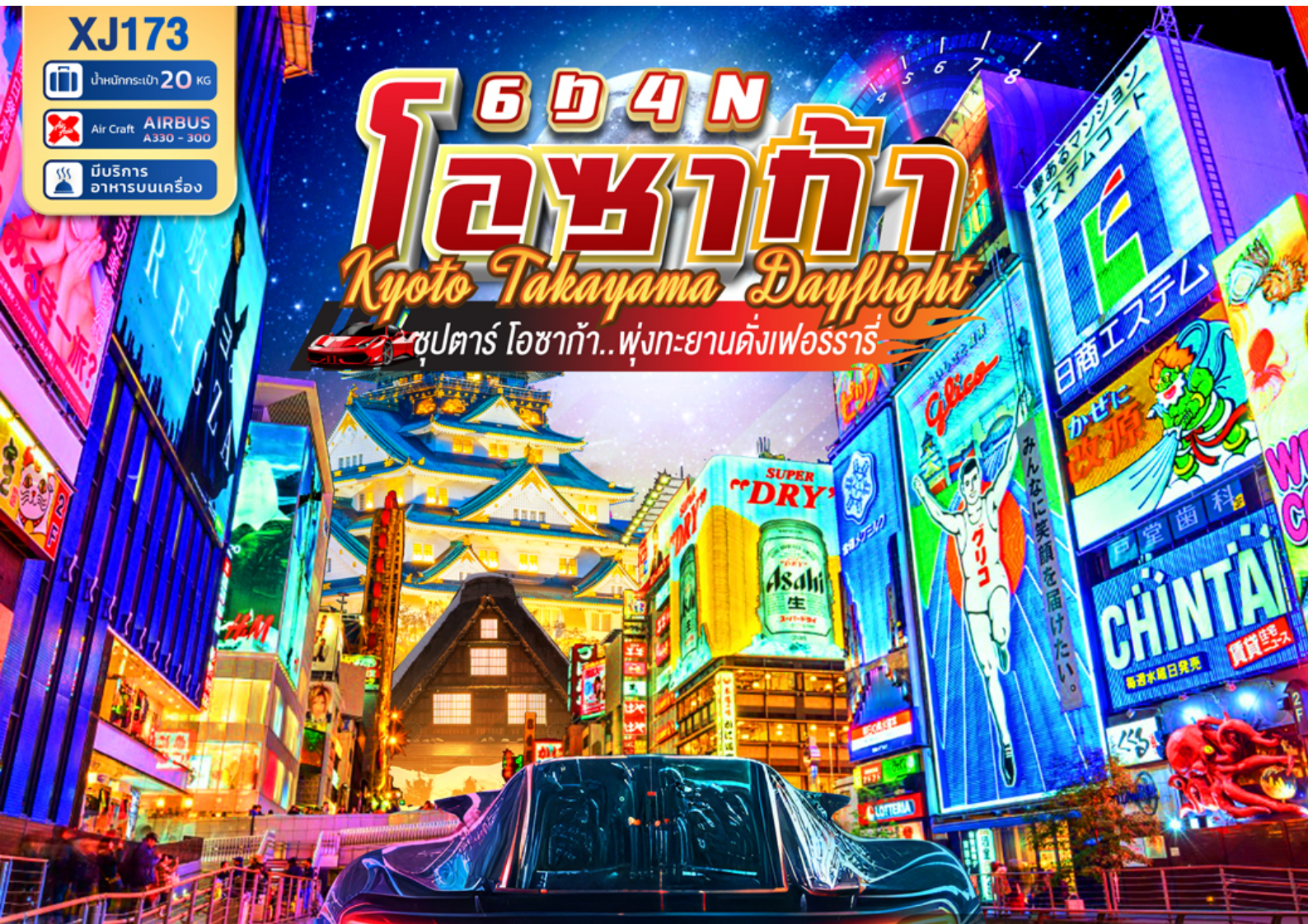
หมู่บ้านมรดกโลก

ชุดตาร์ ไอซาก้า.. ฟุ้งทะยานตั้งเฟอร์รารี