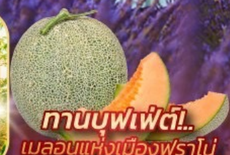
ทานบุฟเฟ่ต์! เมลอนแห่งเมืองฟุราโน่