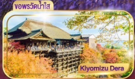
วอพรวัดน้ำใส