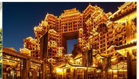
ตึก 72 ชั้น

*ทางบริษัทฯ ขอสงวนสิทธิ์ในการสลับโปรแกรมทัวร์ตามความเหมาะสมขึ้นอยู่กับสถานการณ์หน้างาน โดยคำนึงถึงผลประโยชน์ของลูกค้าเป็นสำคัญ