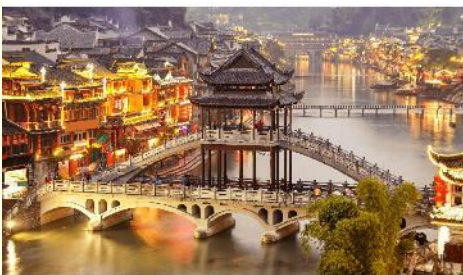
เมืองเฟิ่งหวง