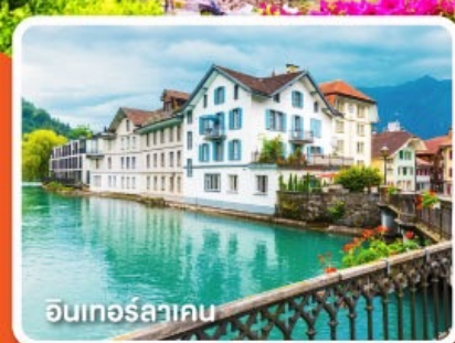
อินเทอร์ลาเคน