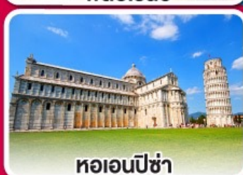
หอเอนปิซ่า