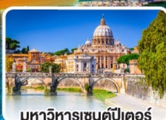
มหาวิหารเซนต์ปีเตอร์