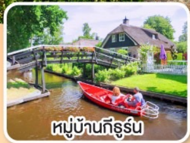
หมู่บ้านกังธูร์น