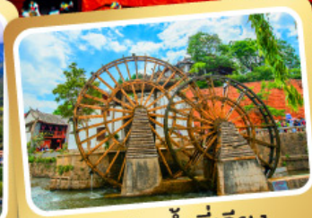
กังหันน้ำลี่เจียง